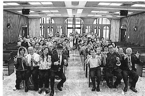
►北投聚會處七十週年感恩聚會

四月27日參加〈北投基督徒聚會處〉七十週年感恩聚會，五月25日又參加了〈龍潭基督徒聚會處〉的感恩聚會；適逢今年七月也是我們教會建堂屆滿六十週年。台灣各地早期建立的聚會處幾乎都已有六、七十年的歷史；一甲子的歲月應該是成熟，開枝散葉的光景，但實際上，卻面對許多的困難和掙扎，同工們在很多的挑戰中，不畏艱難，靠著主復活的大能和聖靈的帶領，眾聖徒同心合意的禱告，持守主真理的見證而得勝。