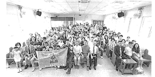
►龍潭聚會處六十週年感恩聚會

操的事工，甚至連西螺浸信宣道神學院，也邀請我們利用體育課教神學生跳讚美操，感謝主，目睹雲林讚美操逐漸在各鄉鎮發展開來，無比感恩；主若願意，希望下半年能再舉辦一次師資培訓，使讚美操在雲林遍地開花，能為主得人如得魚一樣。